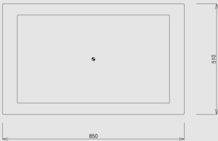
▲ FRONT VIEW