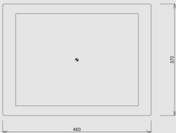
▲ FRONT VIEW